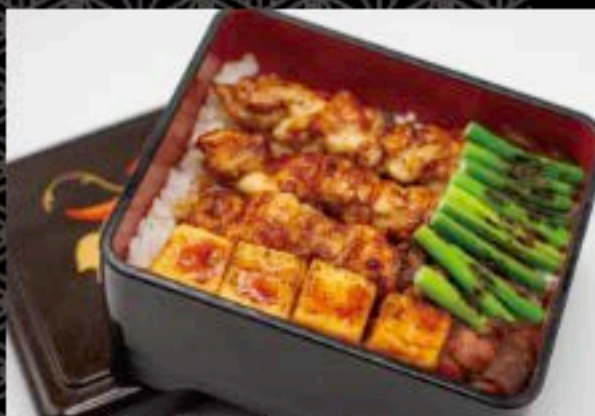
焼とり重 € 18.80 TM