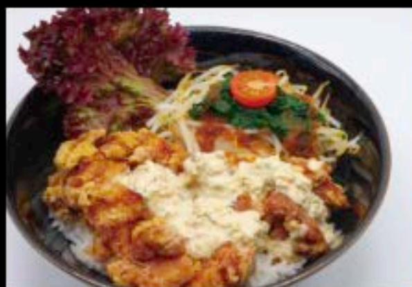
チキン南蛮丼 € 15.80 S.A.R.I.L.M

Grilled vegetable Rice Bowl with Teriyaki sauce Gegrillte Gemüse Reisschale in Teriyaki Soße