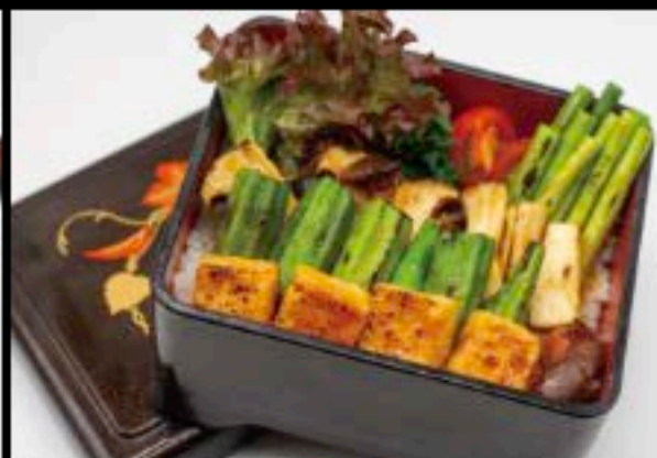
焼ベジ重 € 16.80 TM

Chicken thigh and leek Rice Bowl with Teriyaki sauce Hähnchenschenkel und Gemüse Reisschale in Teriyaki Soße