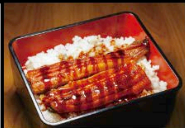
うな重 € 15.80 Z.B.D.I.M

Fried chicken with vinegar and tartar sauce bowl Frittierte Hähnchen Reisschale in Essig und Tartarsoße